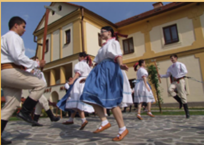
Vystúpenie FS Vepor z Klenovca pred mlynom vo Velkých Teriakovciach