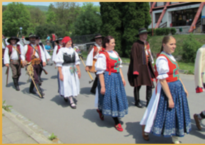
Valašský krúžek písní a tanců Rusavjan z Rusavy a Portáši