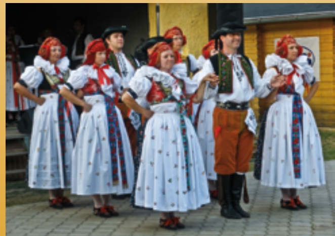
Folklorní soubor Hanačka z Litovle