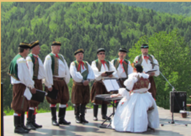
Občanská beseda Kyselovice