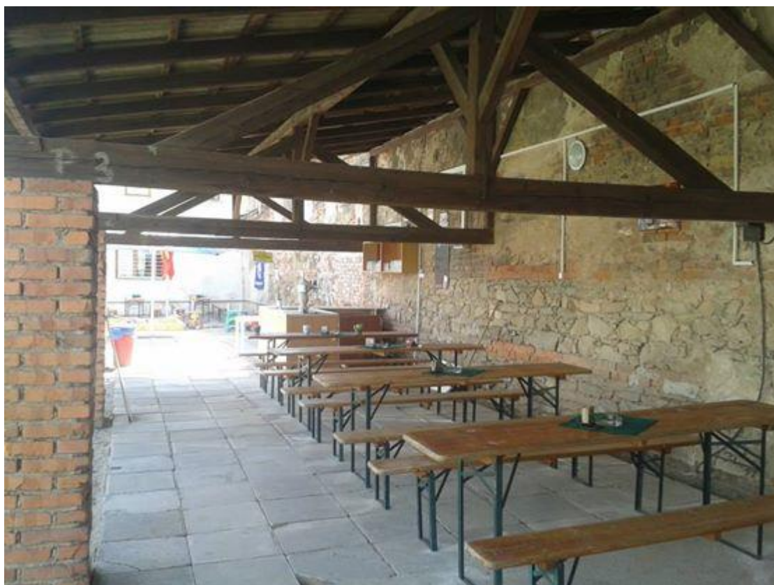
Příloha 11 Restaurace Na pindě – Slavětín