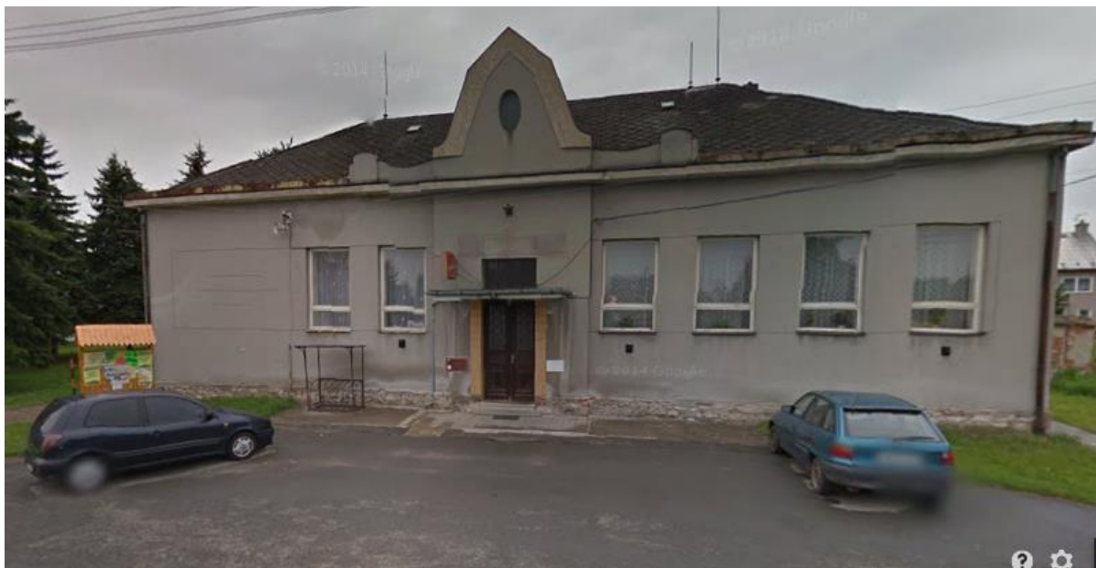
Příloha 43 Nové Mlýny – Řimice (Stodola Nové Mlýny)