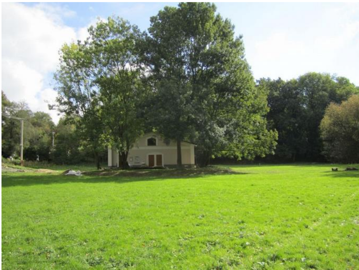
Příloha 44 Březové – Chata Storm