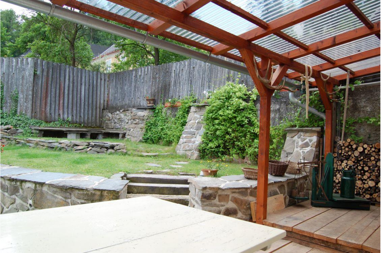
Příloha 6 Penzion – Ubytování Květinová (Křelov)