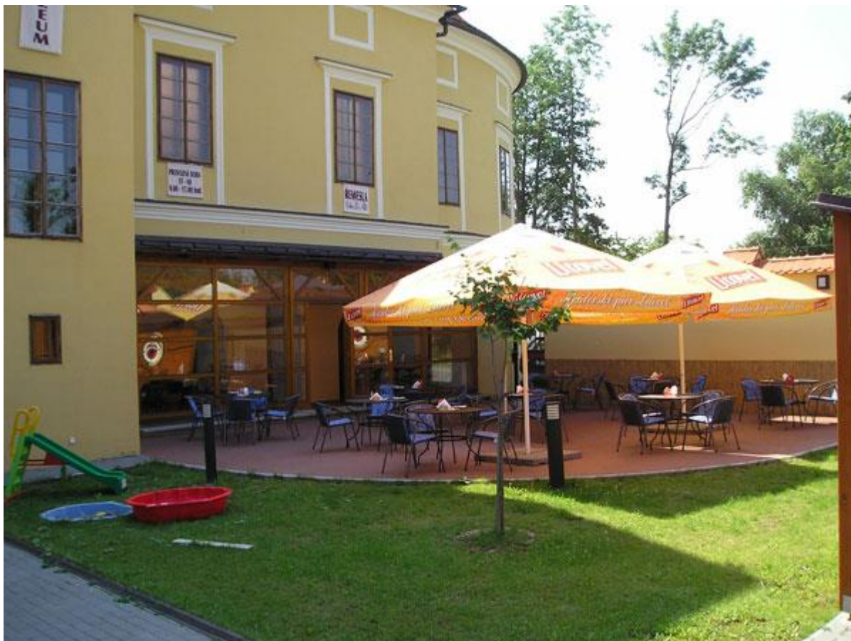
Příloha 34 Penzion Nová Ves – Litovel