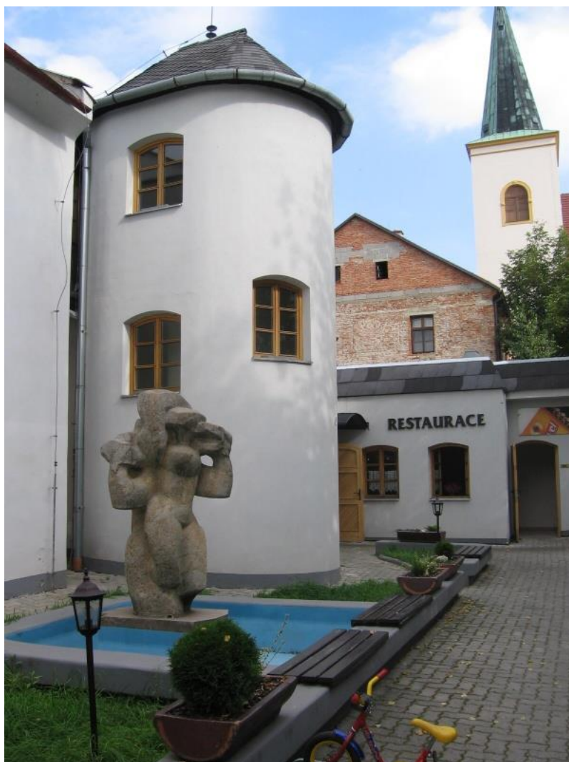
Příloha 38 Restaurant Prachárna – Křelov – Břuchotín