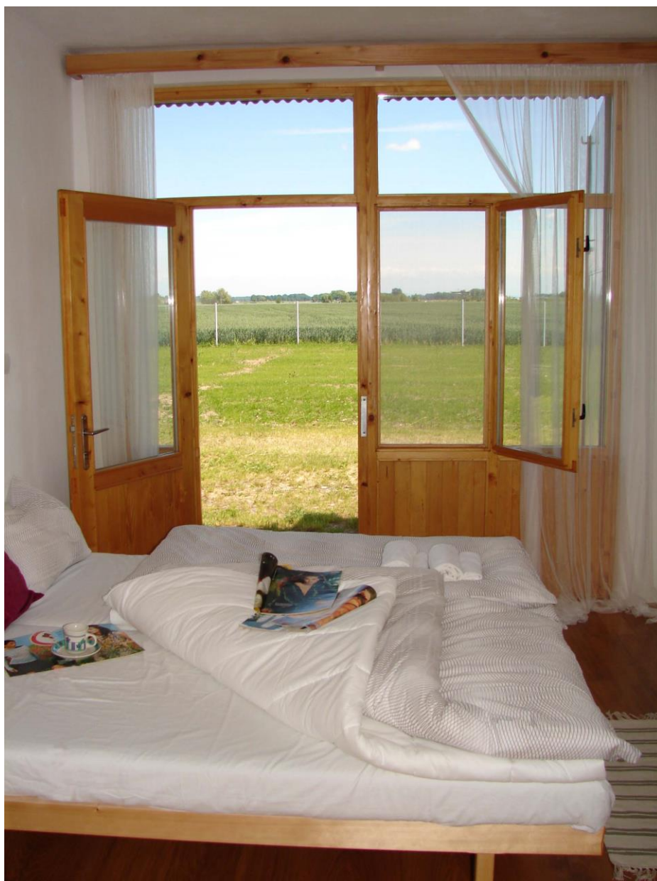
Příloha 45 Nasobůrky – Hostinec