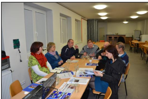
Obrázek 2 Veřejné projednání v obci Cholina dne 18. 1. 2016

Výše uvedená tabulka uvádí přehled účastníků na veřejných projednáních v obcích. Z důvodu obav z nízkého zájmu a účasti v menších obcích se tyto obce spojily se sousedními a uspořádaly besedu společně, jednalo se o obce – Bílá Lhota a Mladeč, Cholina a Dubčany, Litovel a Slavětín.