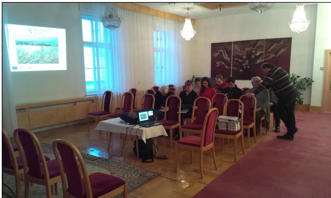
Obrázek 5 Veřejné projednání v obci Luká dne 13. 1. 2016