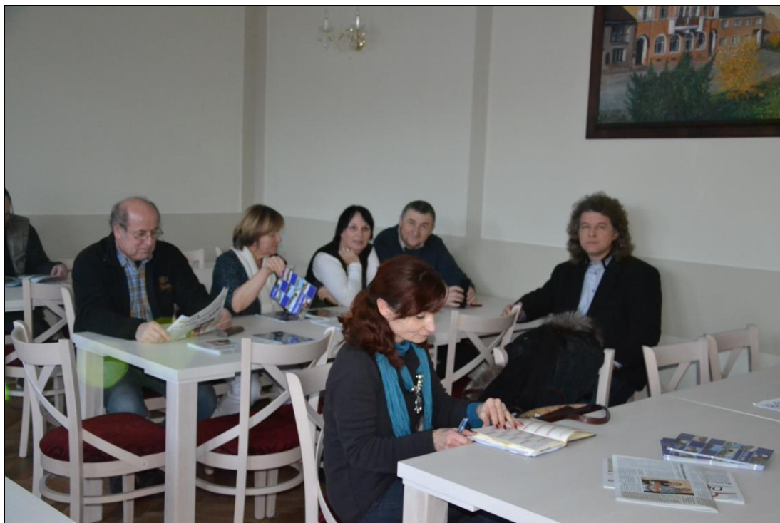
Obrázek 7 Veřejné projednání v obci Náklo dne 21. 1. 2016