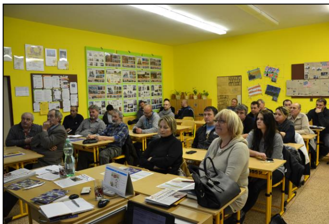
Obrázek 1 Veřejné projednání v obci Luká dne 13. 1. 2016

aby byly se svými záměry, před vyhlášením první výzvy připraveni a probíhaly konzultace těchto zamýšlených projektů.